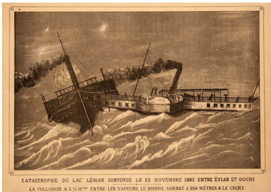
CATASTROPHE DU LAC LÉMAN SURVENUE LE 23 NOVEMBRE 1883 ENTRE ÉVIAN ET OUCHY LA COLLISION A 5 1/2 H 00 ENTRE LES VAPEURS, LE RHÔNE, SOMBRE A 250 MÈTRES & LE CYGNE

A cause de la tempête, le Cygne a quitté Ouchy à 17h25 avec 15 minutes de retard. De son côté, le Rhône est parti d'Evian selon son horaire à 17h15. Pour mieux passer la vague et alterner roulis et tangage plutôt qu'une vague de trois-quarts arrière, le bateau a pris une « relevée », se dirigeant d'abord vers Rolle, avant de changer de cap à mi-lac pour prendre la direction de Lausanne. Le Cygne , qui a renoncé à toucher Evian, se dirige vent debout vers Thonon. Tous deux se trouvent sur une route inhabituelle.