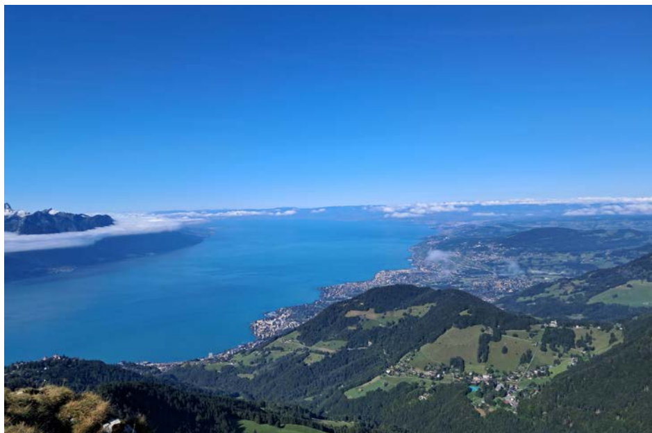
La vue époustouflante sur notre beau Léman depuis les hauts de Montreux

Ayant peut-être fait partie jusqu'alors des domaines de l'abbaye de St-Maurice, la paroisse de Montreux qui s'étendait des limites de la Tour-de-Peilz au secteur de Chillon (regroupant les 3 communes précitées), passa dans la 1ère moitié du XIe siècle entre les mains des évêques de Sion. Pour régler des dettes, l'un de ces évêques doit se résoudre à vendre ladite paroisse en 1295 au sire Girard 1er d'Oron qui meurt en 1311. Son petit-neveu Girard II d'Oron en hérita, mais dut en céder la partie orientale (Les Planches et Veytaux) au comte Amédée V de Savoie et se reconnaître son vassal pour la partie occidentale (Le Châtelard). Au cours des XVe et XVIe siècles, le village de Veytaux prit de l'importance lors de la diminution, puis de la disparition du bourg de Chillon, et finit par devenir une commune indépendante.