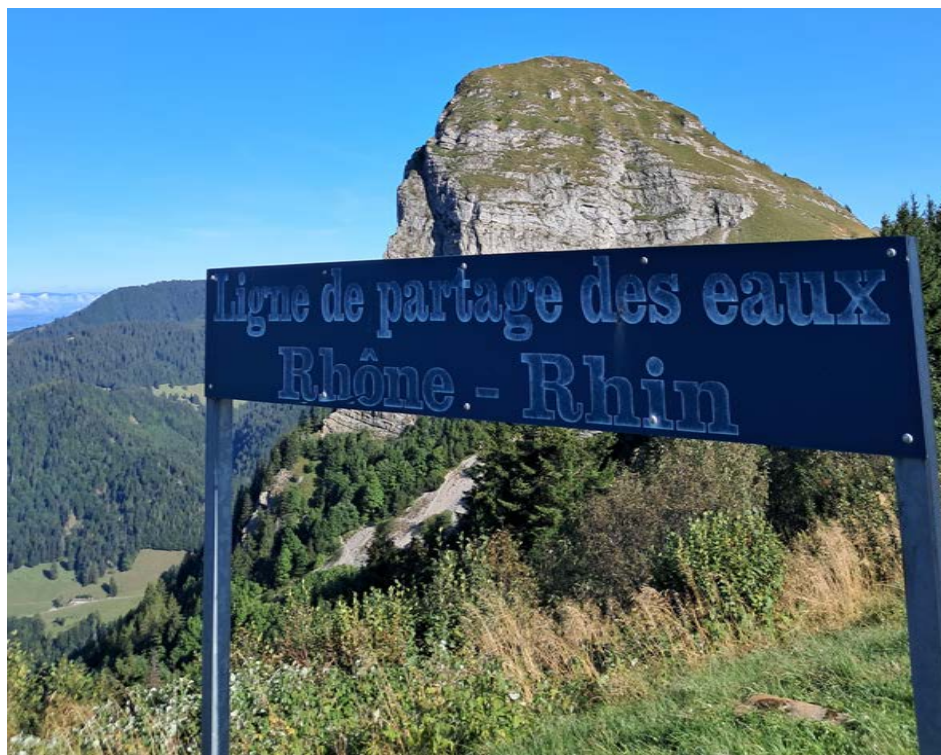
Notre Cervin, la Dent de Jaman