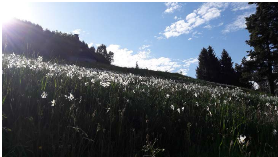
Les narcisses, l'or blanc de Montreux