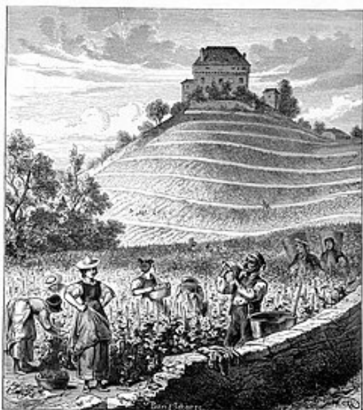
Vendange au pied du Château de Châtelard près de Clarens, Gustave Roux, 1869