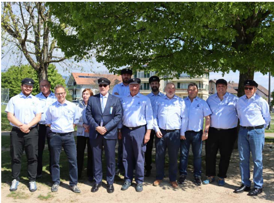
Le Comité central in corpore

Nous lui souhaitons la bienvenue et plein succès dans ses nouvelles fonctions.