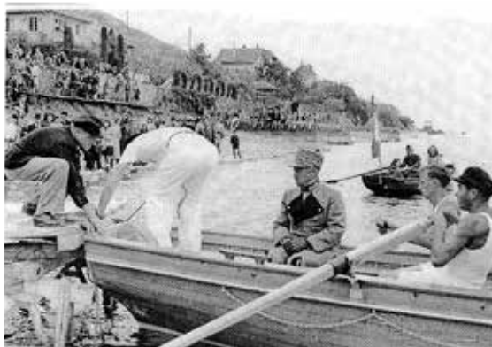
Inauguration du bateau à rame avec la présence du Général Guisan, 1944

Petit retour dans le temps. La section de Villette a été fondée en 1943 lorsque la commune de Villette met à disposition un terrain au bord du lac pour y construire un local et abriter le bateau à rames. L'inauguration de la section s'est déroulée en 1944 avec la présence du Général Guisan qui baptise le bateau et lui donne son nom. Ainsi, la section de Villette assure la garde et la surveillance des bateaux et autres embarcations qui naviguent dans son secteur.