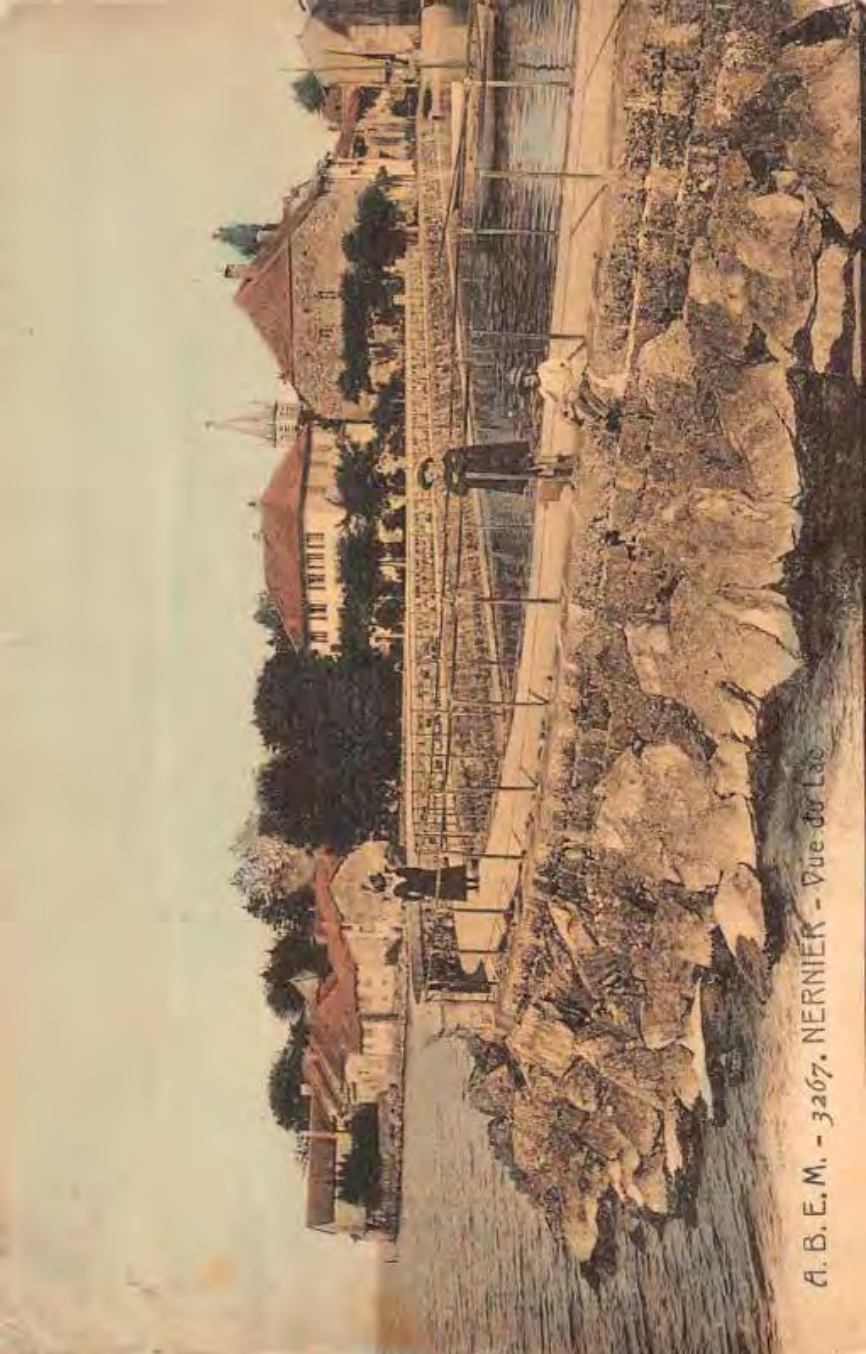
A. B. E. M. - 3267. NERNIER - Vue de Lao