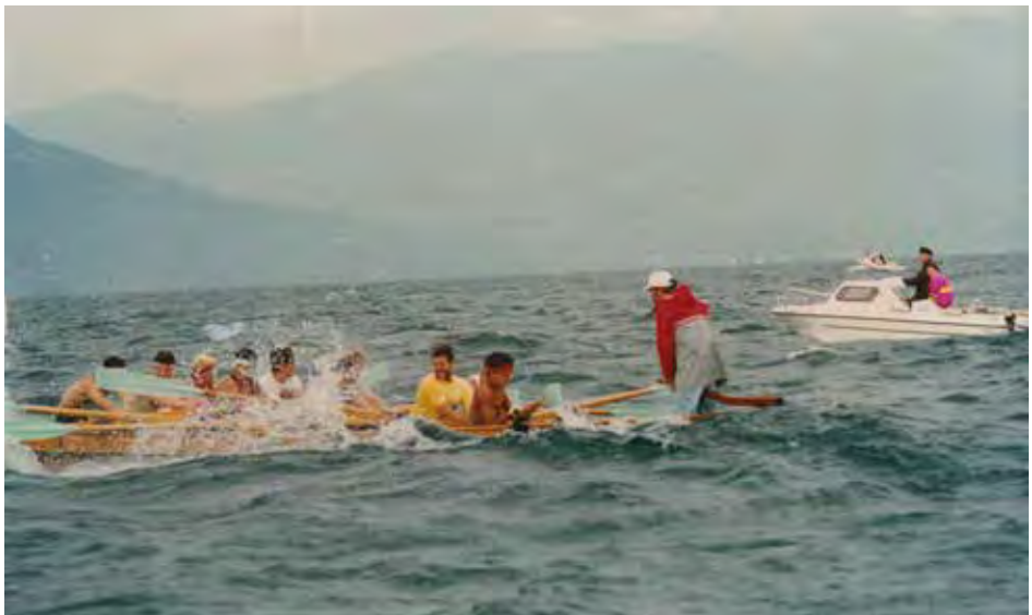
Traversée du lac, 1991