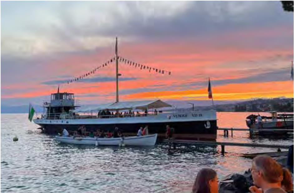
« Le Venoge », 50 e Marathon du Lac, 2023