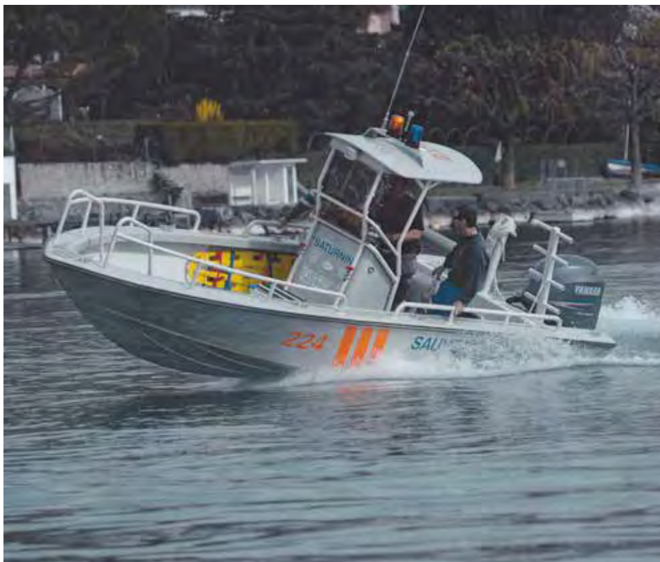
Bateau d'intervention « Saturnin », 2007

Le sauvetage de Villette, c'est aussi le Marathon du Lac organisé depuis 1973. L'épreuve relie Lugrin à la plage de Villette sur une distance d'environ 11,5 kilomètres, réunissant les équipes de rameurs des différentes sections du lac dans un esprit de convivialité et de dépassement de soi.