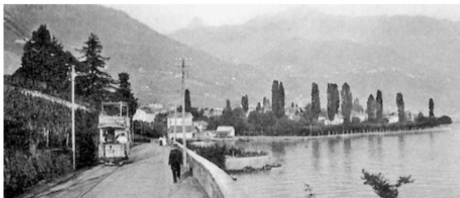
Début du 20 e siècle, le tramway à deux niveaux, au bord du lac.